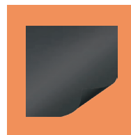
Угол обзора 170° Усиление 0.8

Чёрное полотно прямой проекции, частично поглощает внешнее освещение за счет коэффициента усиления 0.8. Особенностью полотна является его структура, которая позволяет отражать верхний внешний свет в сторону от оси просмотра. Это еще больше повышает контрастность изображения без поглощения света проектора. Подходит для использования проекторов со стандартными и длиннофокусными объективами.