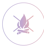
Устойчивость к огню