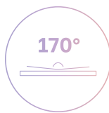
Угол обзора 170°