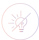
Блокировка внешней засветки