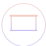
Стильная бархатная рама