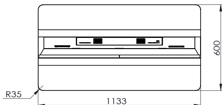
СХЕМА ДИСПЛЕЯ (ВИД СВЕРХУ)