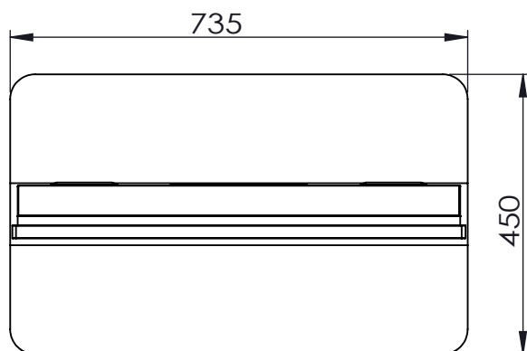
СХЕМА ДИСПЛЕЯ (ВИД СВЕРХУ)