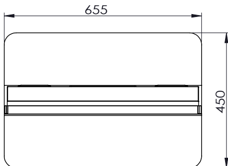
СХЕМА ДИСПЛЕЯ (ВИД СВЕРХУ)